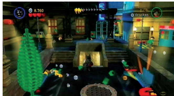
Alles kann zerstört werden. Es sei denn, es handelt sich um Levelbegrenzende Gebäude . Die müssen stehen bleiben.