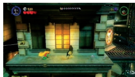
Um Robin von einem zweiten Spieler steuern zu lassen, einfach + drücken.