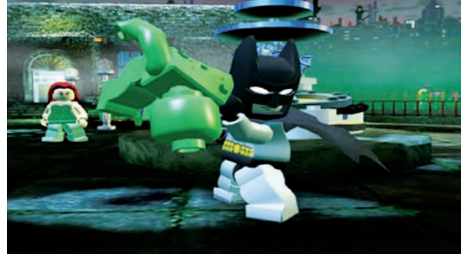
Batman hat so einige Bewegungen drauf. Endgegner stecken deutlich mehr weg als normale Handlanger.