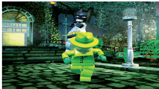
Kein Entkommen für den Bösewicht : Batman setzt zum Sprung an und streckt den Ganoven nieder.