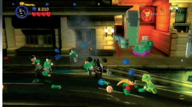
Eine ganz normale Klopperei . Bis zu zehn Schergen müssen hier in Lego-Steine zerlegt werden.