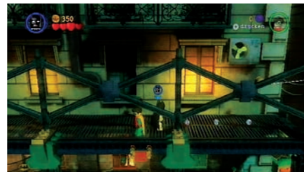
Batman und Robin können auch im Koop gespielt werden. Das macht mehr Spaß.

Der erste Akt beginnt ganz klassisch damit, dass die gesamte Schurkenbande Gothams aus dem Arkham Asylum ausbüchst. Die entfesselte kriminelle Energie ergießt sich auch gleich über die Stadt. Die Polizei ist angesichts des Verbrechermobs hilflos. Commissioner Gordon drückt den Knopf und Sekunden später steht