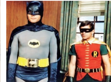
Adam West als Batman in den 1960er Jahren. Eher komisch als heldenhaft.

Adam West, der in der ersten Batman-TV-Serie von 1966 bis 1968 den Fledermausmann spielte, hatte neben William Shatner (James T. Kirk im Raumschiff Enterprise) das wohl undankbarste Kostüm. Beide Recken mussten heroisch den Bauch einziehen, denn die enganliegenden Kostüme machten jedes Gramm Fett sichtbar. Helden mit Bauchansatz? Wo gibt's denn sowas? Einem Christian Bale stehen heute eine ganze Horde Personal Trainer zur Seite. So wird aus Bruce Wayne ein muskulöses, ganz in schwarz gekleidetes Schreckgespenst. Vergleicht man beide Batmänner, wirkt West heute tatsächlich eher komisch als heldenhaft auf uns.